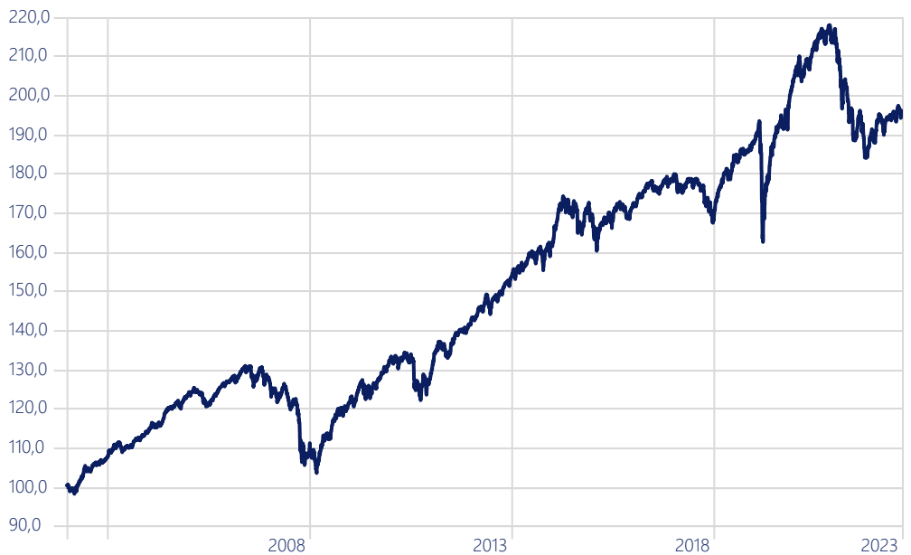
—MomentumPlus Aktiv Portfolio Defensiv