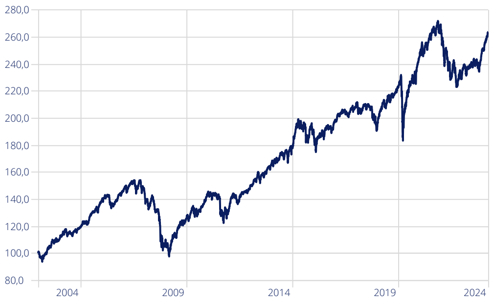
— Moventum Deutschland Ausgewogenes Portfolio