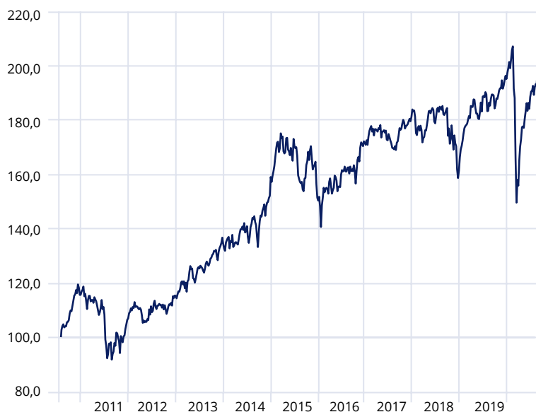
Moventum Portfolio Global Growth *