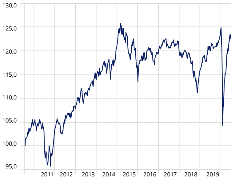
Moventum Portfolio Global Defensive*