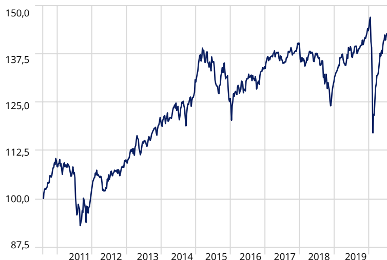
Moventum Portfolio Global Balanced*