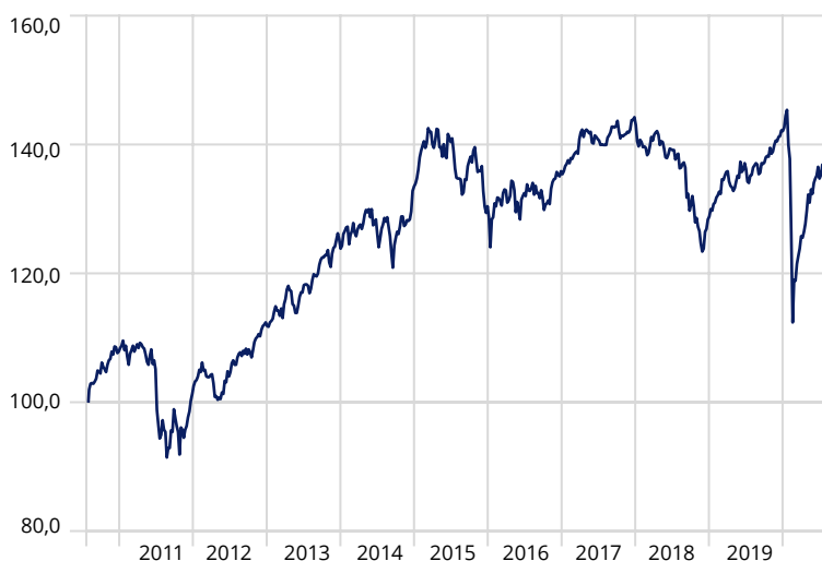
Moventum Portfolio Europe Balanced*